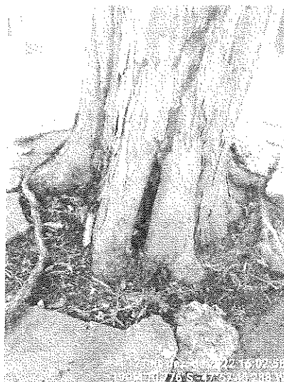
Figura 1 – Sibipiruna inclinada, necrosada e infestada com cupins.